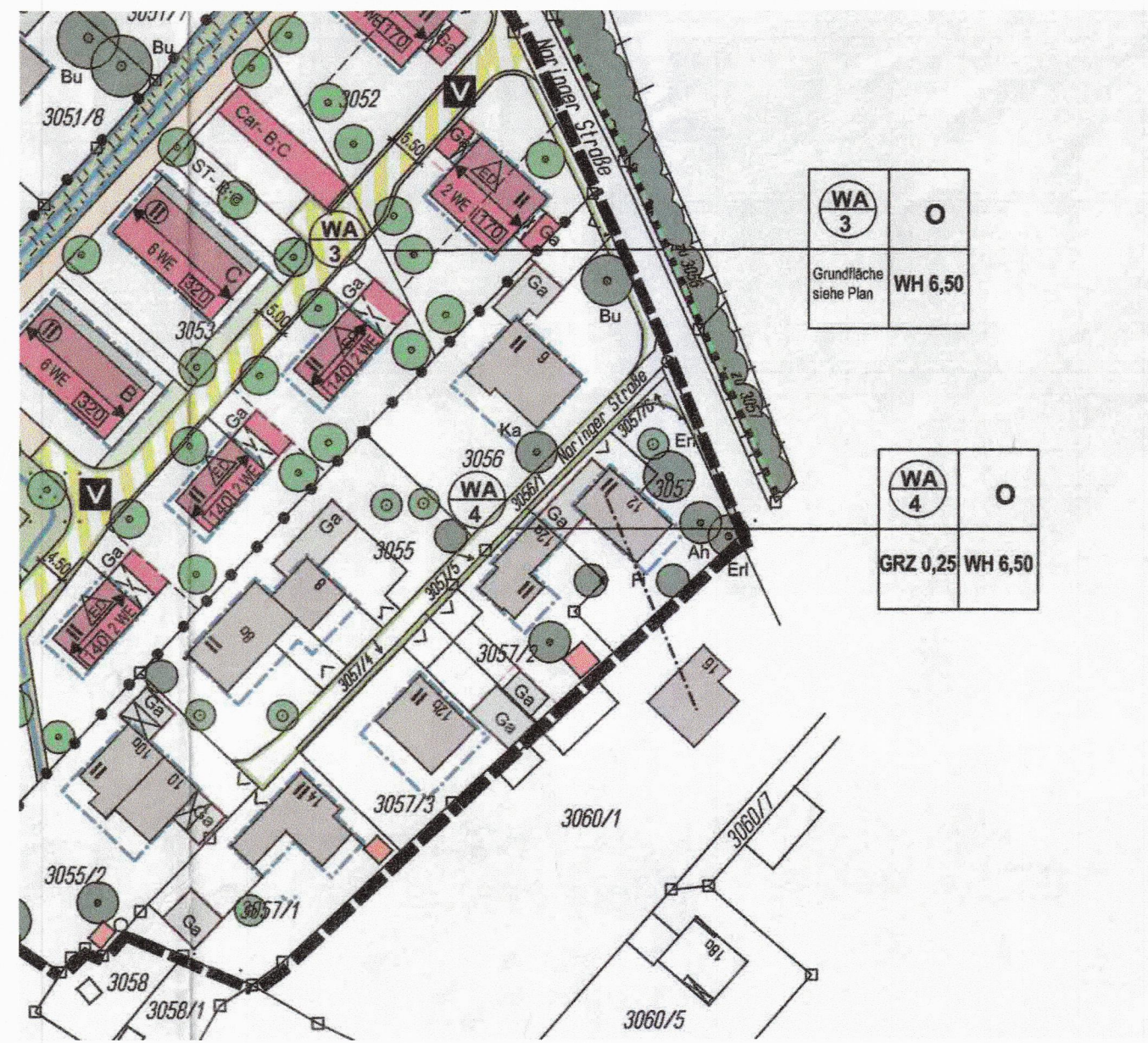
Auszug Bebauungsplan Nr. 94 "Am Kapellenbach" M 1 : 1000

Amt für Digitalisierung, Breitband und Vermessung Rosenheim Münchener Straße 23 83022 Rosenheim Erstellt am 29.07.2021