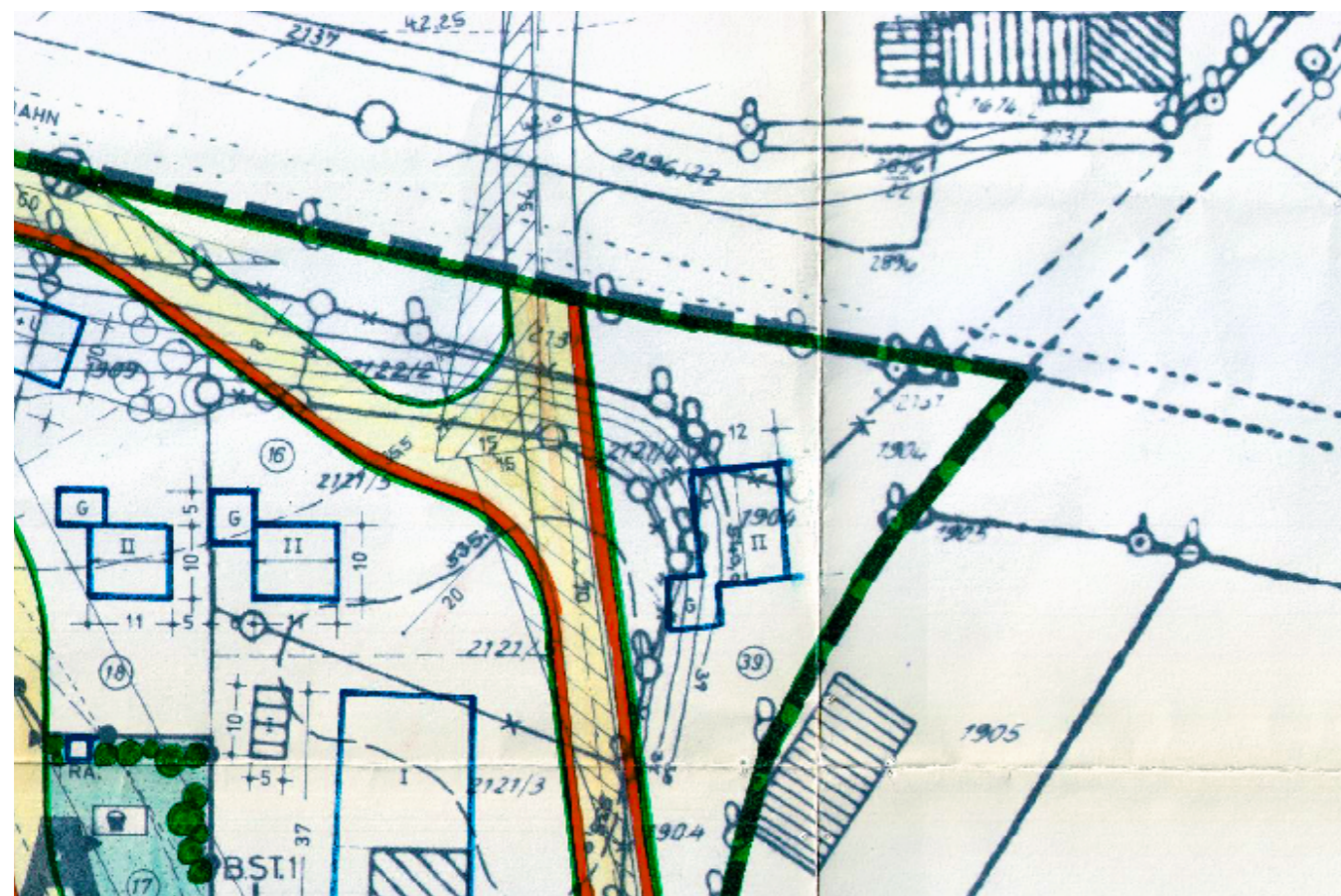
AUSSCHNITT AUS RECHTSKRÄFTIGER 6. ÄNDERUNG DES BEBAUUNGSPLANES NR. 43 "IM HOFPOINT"