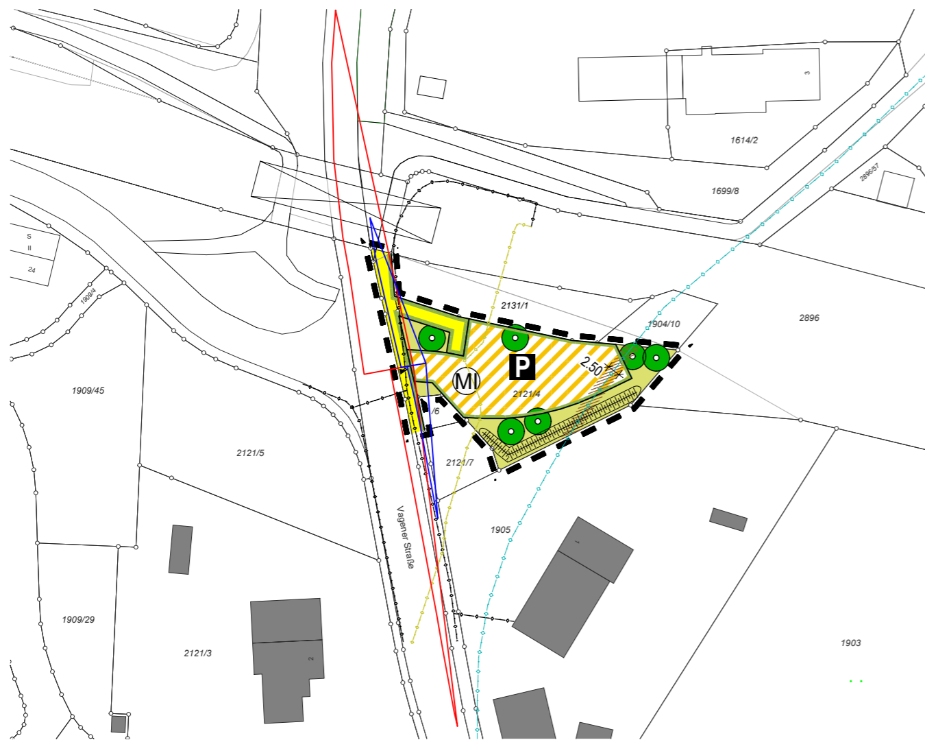
12. ÄNDERUNG B-PLAN NR. 43 "IM HOFPOINT" M 1/1000