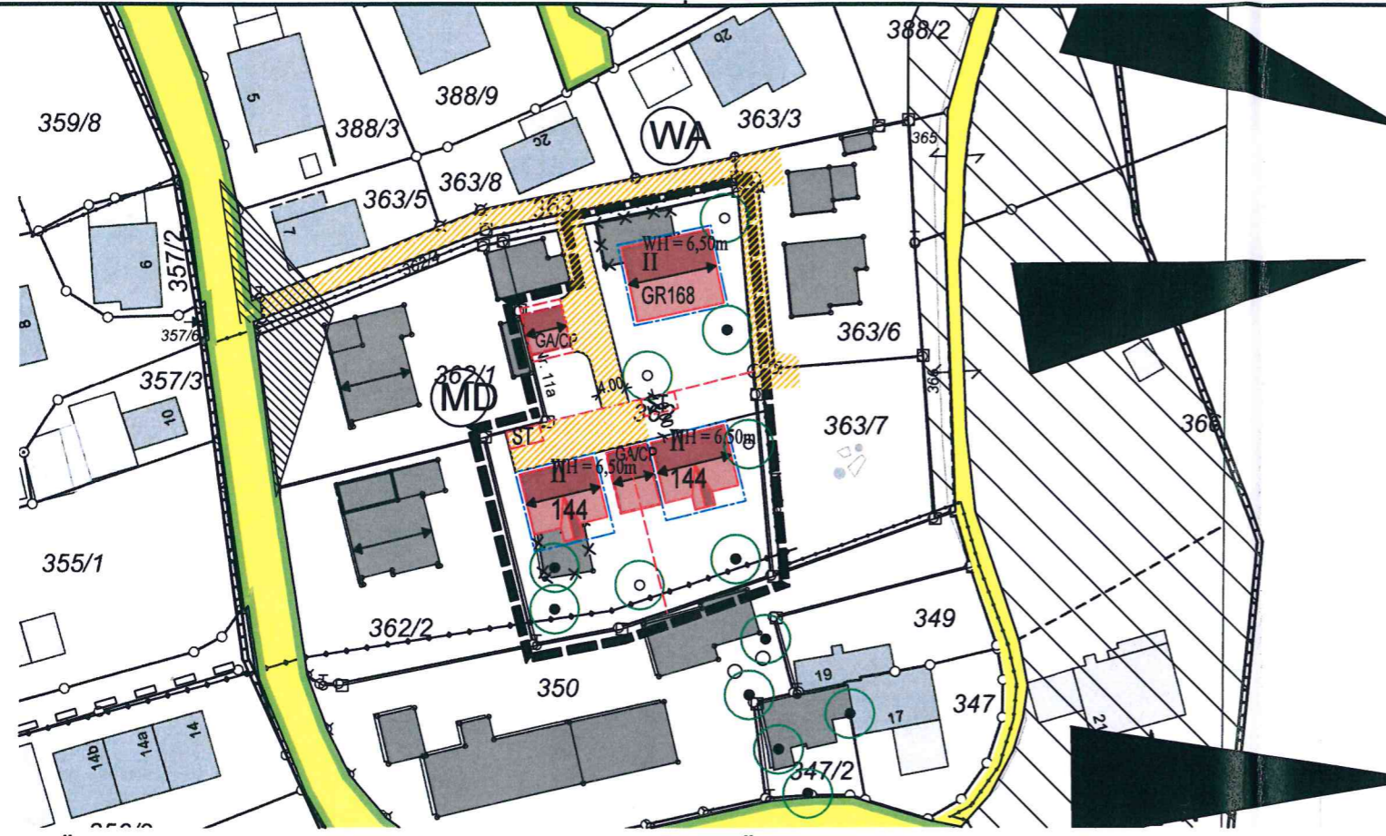
11. ÄNDERUNG DES BEBAUUNGS-PLAN NR. 55 "SCHÄFERERWEG" M 1/1000