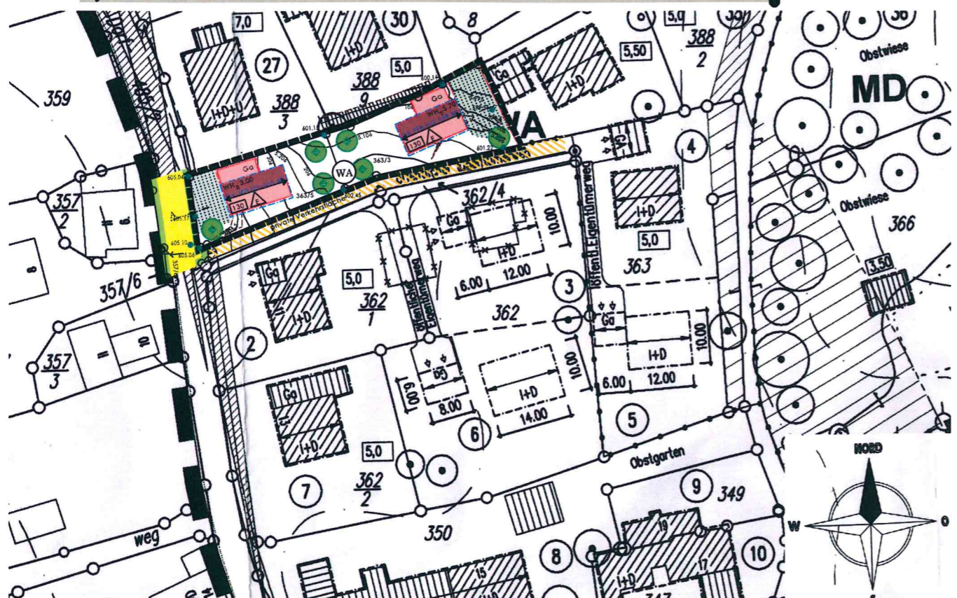
AUSSCHNITT 3./6. ÄND. DES RECHTSKRÄFTIGEN BEBAUUNGSPLAN NR. 55 "SCHÄFERERWEG"