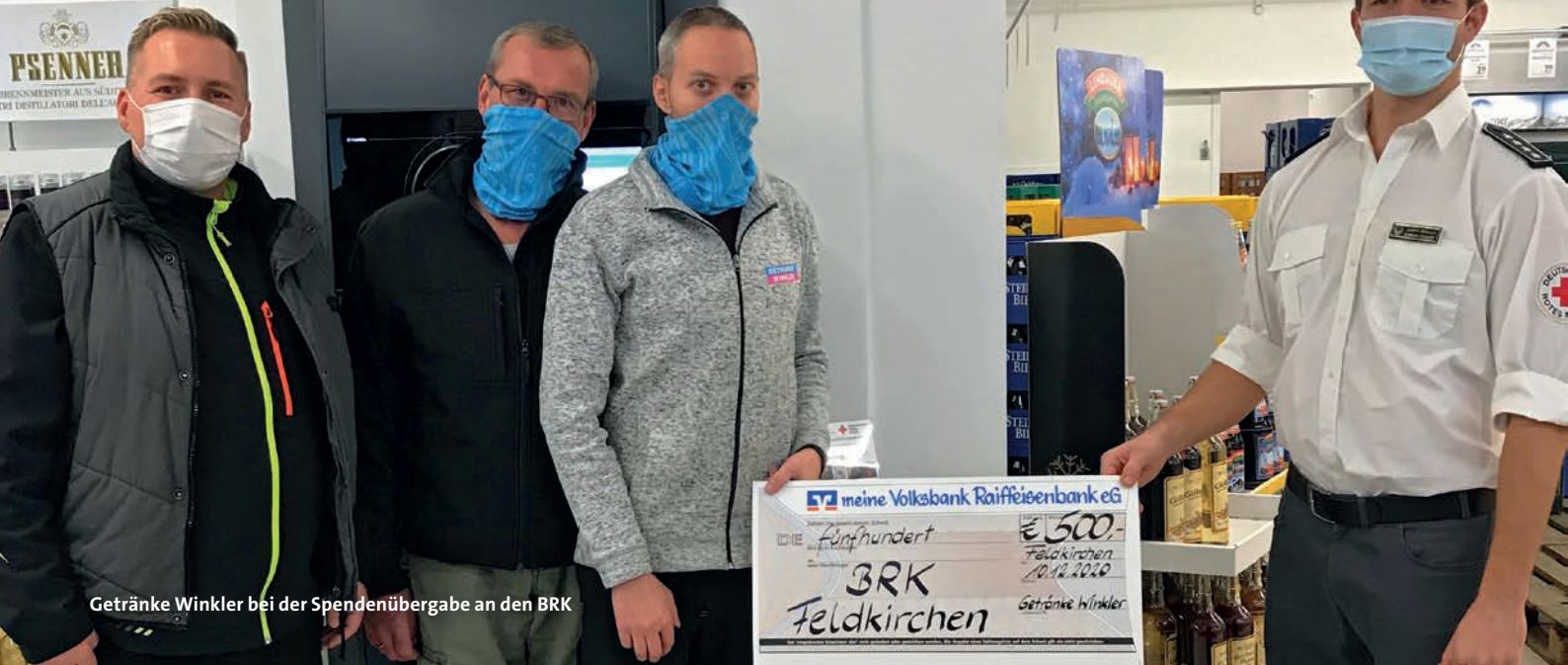
Getränke Winkler bei der Spendenübergabe an den BRK