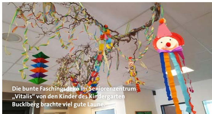
Die bunte Faschingsdeko im Seniorenzentrum „Vitalis“ von den Kinder des Kindergarten Bucklberg brachte viel gute Laune.

Wir hoffen, dass nun bald wieder so etwas wie „Normalität“ bei uns einkehrt und wir wieder alle Kinder im Kindergarten begrüßen können.