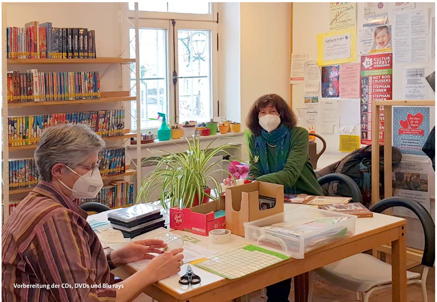
Vorbereitung der CDs, DVDs und Blu rays