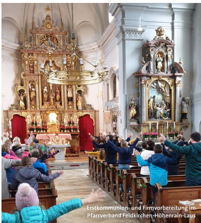
Erstkommunion- und Firmvorbereitung im Pfarrverband Feldkirchen-Höhenrain-Laus

Der Gottesdienst findet jeden Sonntag in der Emmauskirche um 10.30 Uhr statt, bei schönem Wetter im Innenhof. Eine FFP2-Maske ist während des gesamten Gottesdienstes zu tragen, es darf nicht gesungen werden und ein Abstand von 1,5 Metern zu anderen Teilnehmern ist einzuhalten.