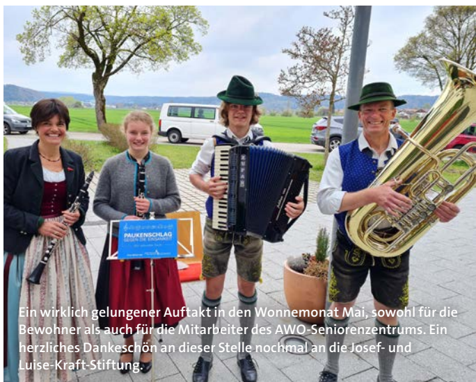
Ein wirklich gelungener Auftakt in den Wonnemonat Mai, sowohl für die Bewohner als auch für die Mitarbeiter des AWO-Seniorenzentrums. Ein herzliches Dankeschön an dieser Stelle nochmal an die Josef- und Luise-Kraft-Stiftung.

Wohnberatung im Landratsamt Rosenheim Brigitte Neumaier Tel. 08031-3922281 – www.landkreis-rosenheim.de oder bei der Nachbarschaftshilfe Feldkirchen-Westerham Tel. 08063-200805 – Email: geschaeftsstelle@nbh-fw.de .