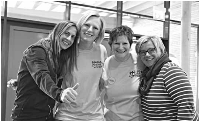
Gute Laune bei den Helfern des Räderbazar

Apropos Helfer: Wer sich gerne dem tollen Bazar-Team anschließen möchte, bekommt ein Vorkaufsrecht vor allen übrigen Schnäppchenjägern. Second Hand ist gut für die Umwelt: Indem wir gebrauchte Sport-Geräte, Kleidung oder Räder kaufen, schonen wir wertvolle Ressourcen, die sonst bei der aufwendigen Neuherstellung verbraucht werden würden. Dass wir so auch noch unseren Geldbeutel schonen, ist ein positiver Nebeneffekt. Der Veranstalter, die Freunde und Förderer der Grundschule Feldkirchen-Westerham, richtet den Räder- und Sportbazar explizit an alle „großen“ und „kleinen“ Sportlerinnen und Sportler. Da es ein Bazar für Frühjahr und Sommer ist, wird lediglich Wintersportausrüstung vom Verkauf ausgenommen.