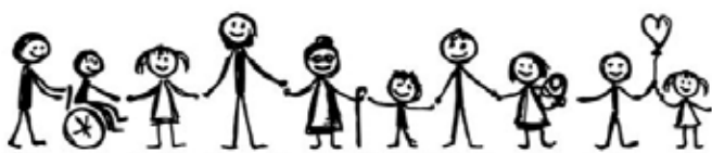
Ökumenische Nachbarschaftshilfe Feldkirchen-Westerham e.V.