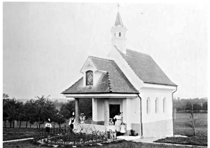
Kapelle beim Magdalenenhof um 1900

Miesbacherstraße 10, 83620 Feldkirchen-Westerham, Telefon: 08063/9931 Mi/Do/Fr: 8 – 12 und 14 – 18 Uhr, Sa: 8 – 12 Uhr, www.schuhmacherei-allinger.de