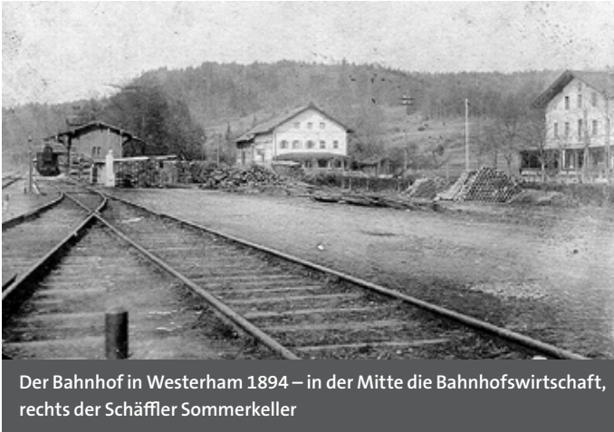
Der Bahnhof in Westerham 1894 – in der Mitte die Bahnhofswirtschaft, rechts der Schächler Sommerkeller