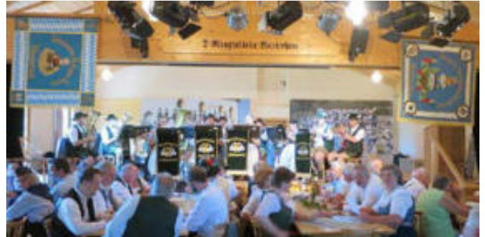
Für einen feierlichen Rahmen sorgten die Niklasreuther Musi und die Waldheimer Böllerschützen.