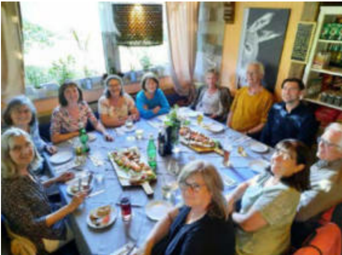
Gemeinsames Essen der ehrenamtlichen Helfer der Betreuungsgruppe für Senioren.

Im Nachgang zur Preisverleihung des Pflegecompass fand nun ein geselliges Abendessen unserer ehrenamtlichen Mitarbeiter statt. Unsere ehrenamtlichen Kollegen der Betreuungsgruppe für Senioren hatten im letzten Jahr den Preis gewonnen und sich sehr über ein Preisgeld gefreut. Neben neuen Anschaffungen für die Betreuungsgruppe, wünschten sich die Ehrenamtlichen auch ein gemeinsames Abendessen. Am 01. August trafen sich alle Mitarbeiter der Betreuungsgruppe des Sozialen Netzwerks und dem Caritas Zentrum Bad Aibling bei El-Greco in Großhelfendorf, um gemeinsam einen schönen lebendigen Abend, mit sehr gutem Essen zu genießen.