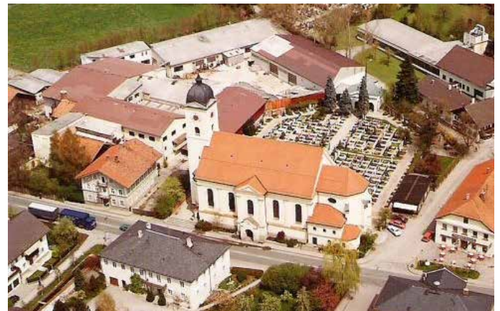
Lederfabrik Petzinger neben der Kirche und dem Friedhof, Bild von 1984

Die Heimatkundliche Sammlung in der Alten Post ist immer donnerstags von 14-17 Uhr geöffnet. Bei uns finden sie Bilder, Unterlagen, Dokumente und Ereignisse zur Geschichte der Gemeinde Feldkirchen-Westerham. Wir freuen uns immer über weitere Dokumente jeder Art zur Geschichte der Gemeinde.