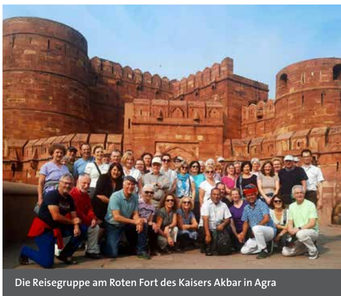
Die Reisegruppe am Roten Fort des Kaisers Akbar in Agra