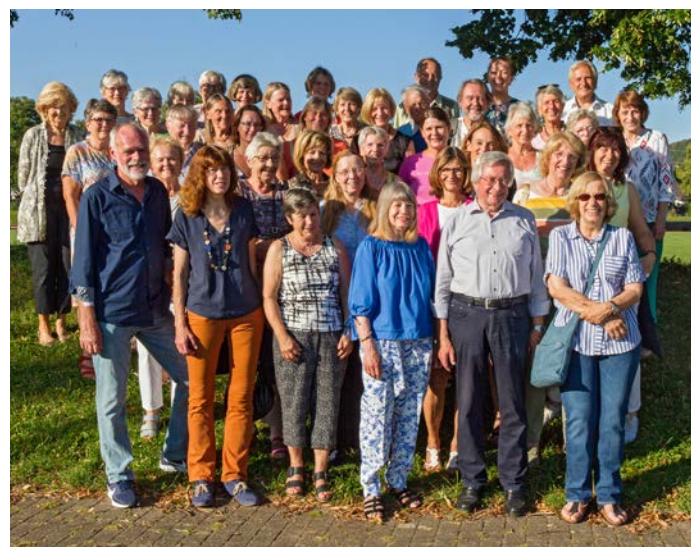
Das ehrenamtliche Team der Bücherei

In diesem Buch lernen Kinder, Grenzen zu setzen, auf ihr Bauchgefühl zu hören und sich vor sexuellem Missbrauch zu schützen.