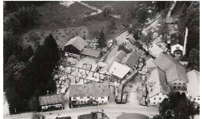
Das ehemalige Marmorwerk Lei, rechts die Papierfabrik Steininger, links die Mangfall, ca. 1955

Die Heimatkundliche Sammlung ist donnerstags von 14-17 Uhr geffnet, in den Schulferien nur eingeschrnkt. Bei uns finden Sie Bilder, Unterlagen, Dokumente und Ereignisse zur Geschichte der Gemeinde Feldkirchen-Westerham. Wir freuen uns auch immer ber weitere Dokumente jeder Art zur Geschichte der Gemeinde.