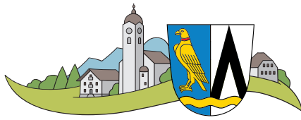
HEIMATKUNDLICHE SAMMLUNG FELDKIRCHEN-WESTERHAM