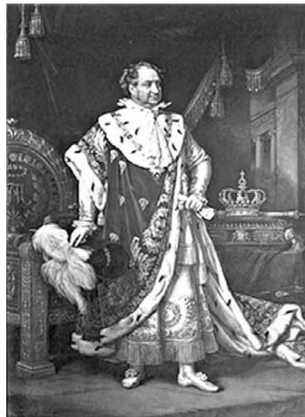
König Max I. Joseph