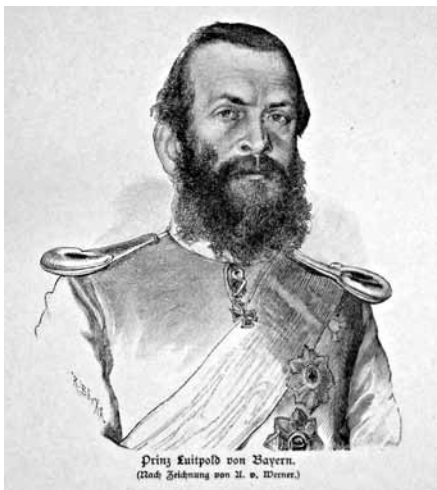
Prinzregent Luitpold Regent Bayerns von 1886 - 1912