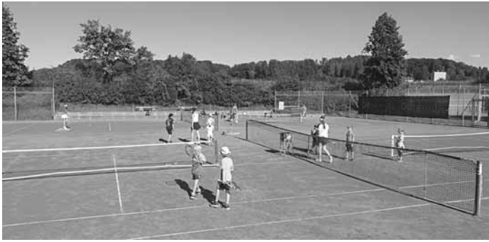
Kinder bei Tennisübungen im Rahmen des Ferienprogramms