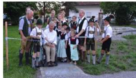
Blaahaus Kiefersfelden barrierefrei