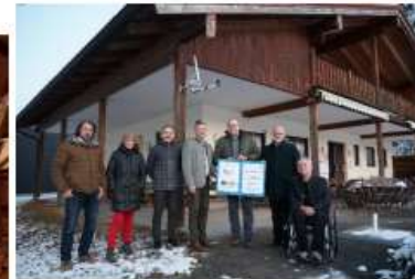
Zukunftsfähiges Sportheim Raubling