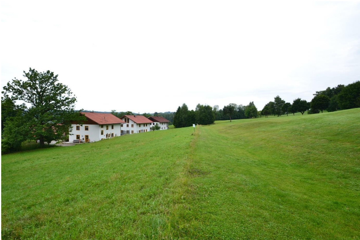
Foto: Hochwassergerinne / Übergang zum Golfplatz

Zur Schonung der natürlichen Bodenfunktionen, einer gleichmäßigen Oberflächenwasserableitung und damit einer Unterstützung des Wasserhaushaltes sind Stellplätze und Zufahrten außerhalb der überbaubaren Grundstücksflächen ausschließlich in offenen und wasserdurchlässigen Materialien zu befestigen.