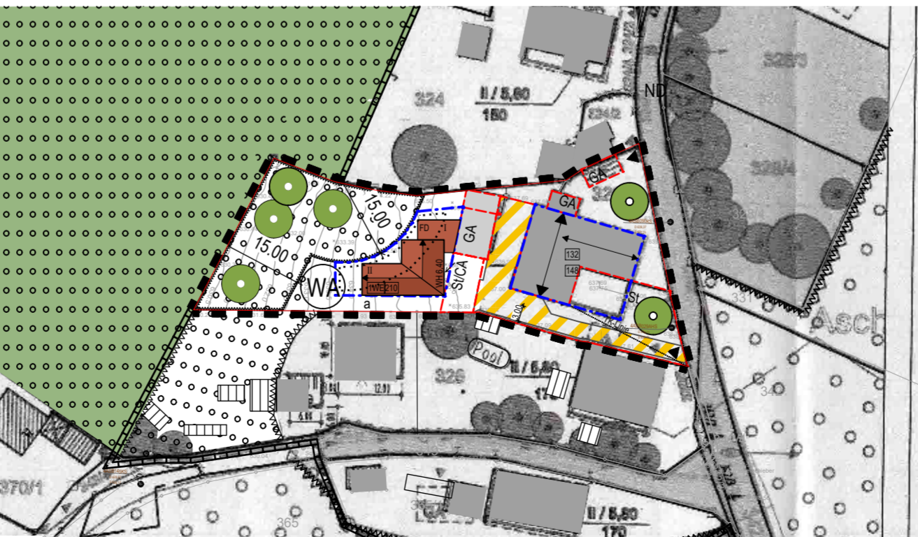
13. ÄNDERUNG B-PLAN NR. 69 "ASCHBACH-ALTENBURG" M 1/1000