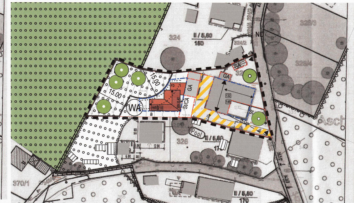
13. ÄNDERUNG B-PLAN NR. 69 "ASCHBACH-ALTENBURG" M 1/1000